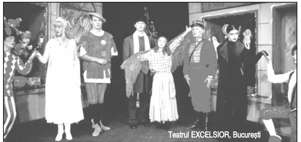
Teatrul EXCELSIOR, București