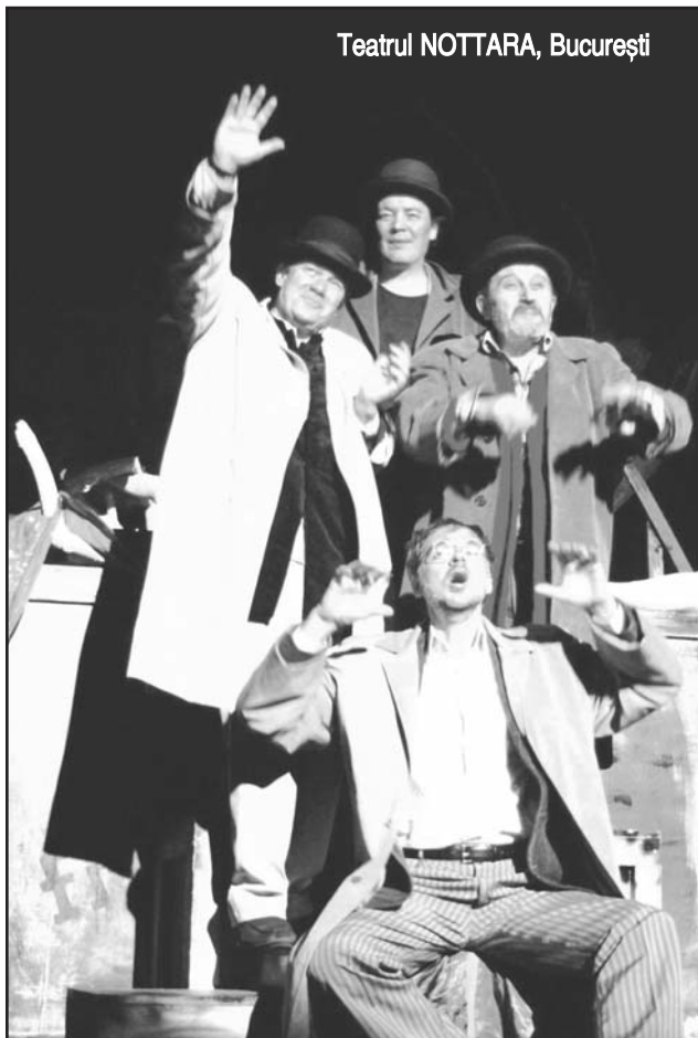
Teatrul NOTTARA, București