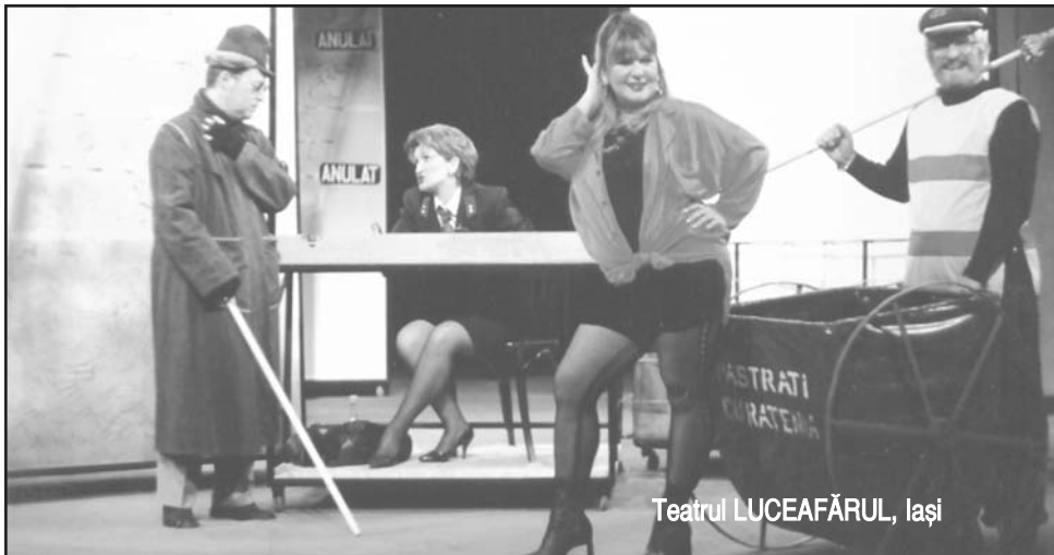
Teatrul LUCEAFĂRUL, Iași

● Imobilul care adăpostește Palatul Copiilor, cunoscut sub numele de Casa Lalu, va fi cumpărat de municipalitate, care îi va păstra actuala destinație. După mai multe runde de negocieri cu reprezentanții moștenitorilor, conducerea Primăriei a încheiat o convenție cu aceștia, obținînd o reducere de preț, de la 500000 de euro, la 462.500 de euro, cu posibilitatea de plată în șase rate.