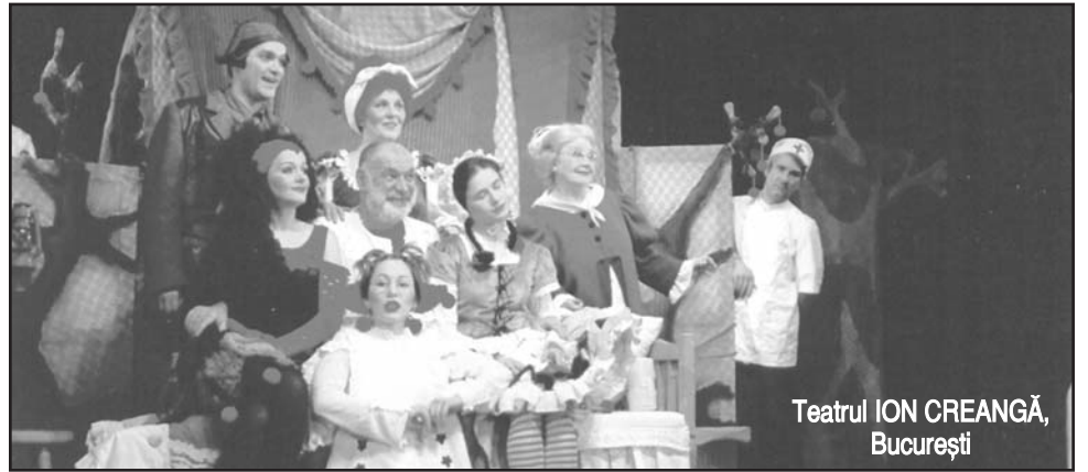
Teatrul ION CREANGĂ, București